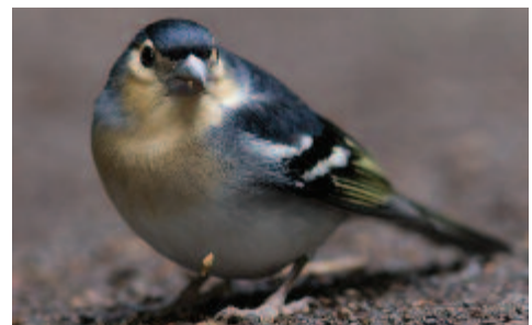
Kék pinty (Fringilla teydea)

A Kanári-szigeteken, Tenerifén és Gran Canarián a fenyvesekben él; színezete kékes ezüstszürke. Ebbe a családba tartozik az Uru-