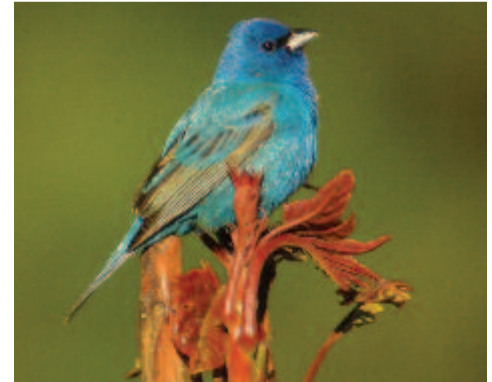
Indigópinty (Passerina cyanea)

Keleten lakik a türkizkék, indigókék fejte-