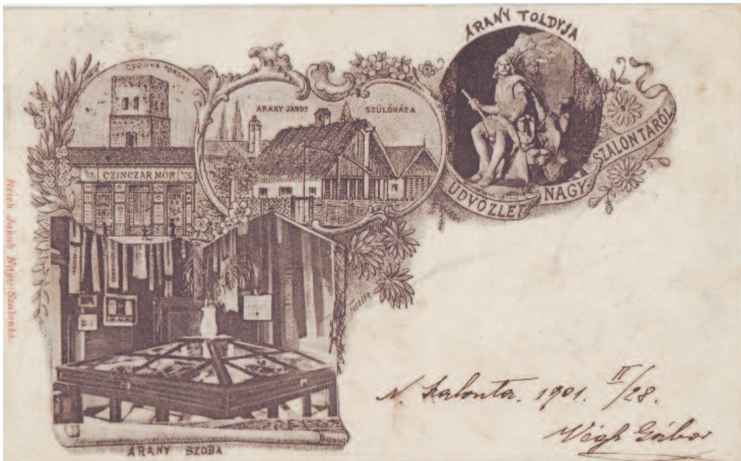
Arany János tiszteletére nyomtatott képeslap 1901-ből