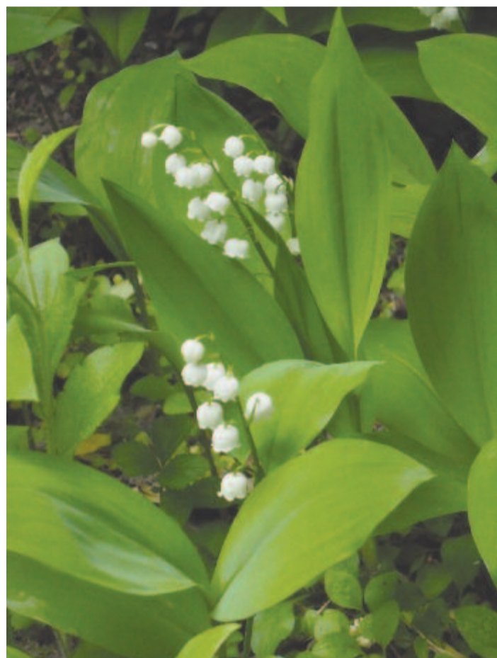
Májusi gyöngyvirág illata belengi a csalitokat

Május a virághógyólyók. Májusban hajlongnak az eszmék.