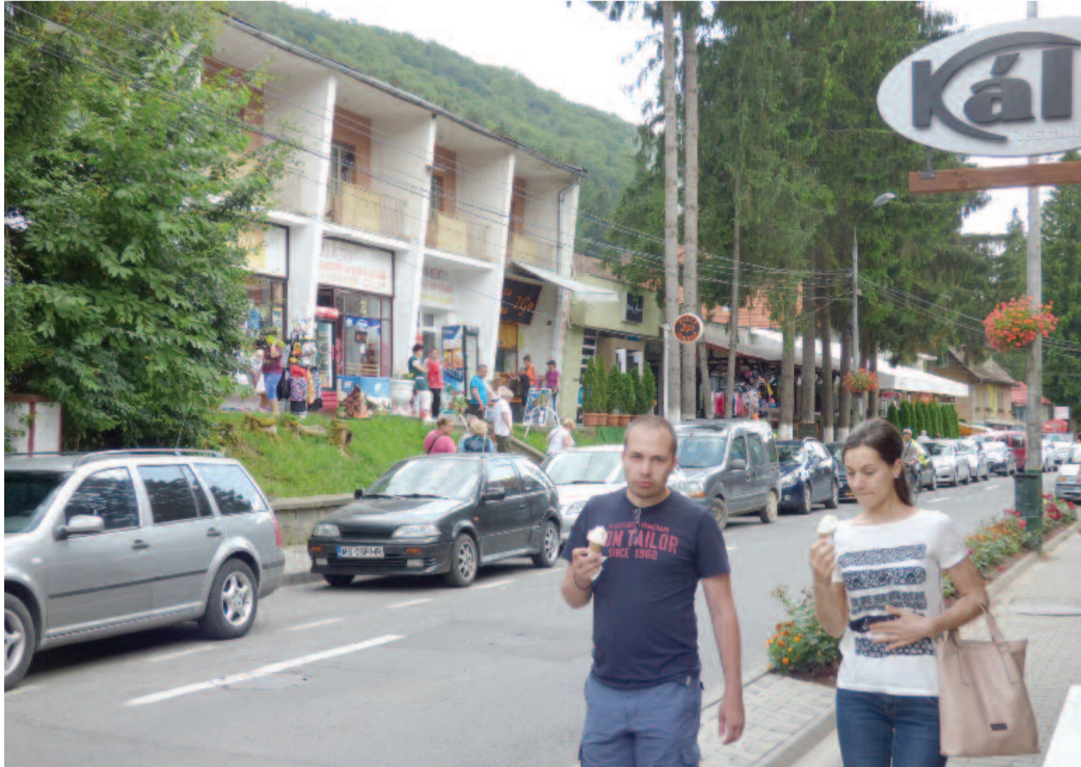
A turisták érkezése előtt rendbe teszik a várost